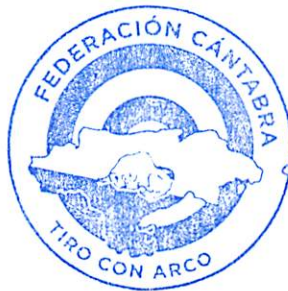
Concepción Coca Barreales